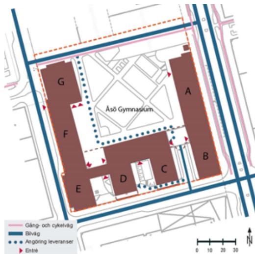
Situationsplan Åsö gymnasium